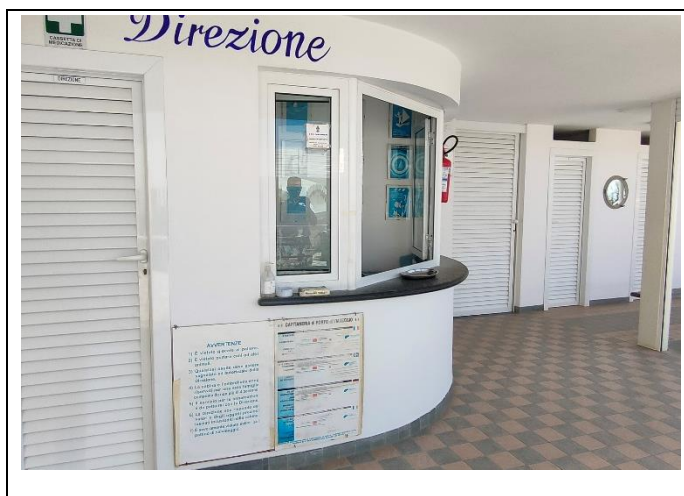
Area ricevimento in piano